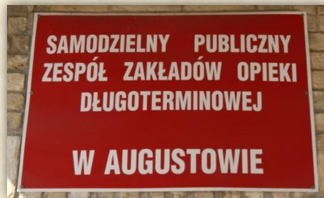
Z wizytą w Hospicjum