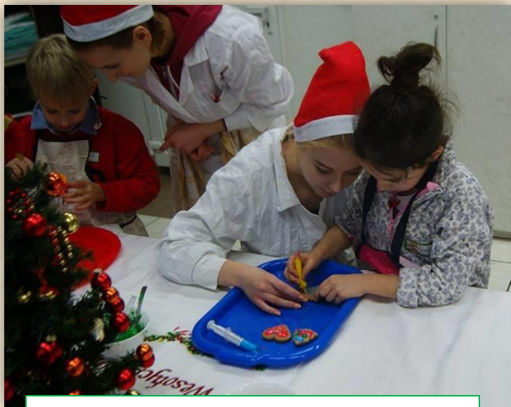
Warsztaty Kulinarne dla uczniów szkół podstawowych

Cyklicznie organizujemy m.in. Zbiórkę Krwi (szkoła promuje honorowe oddawanie krwi), Szkolny Konkurs Nakrywania Stołów, konkurs o najlepszego ucznia w zawodzie kucharz, Szkolny Konkurs Wiedzy o Żywieniu Człowieka, Konkurs Wiedzy o Cukrzycy, Warsztaty Kulinarne dla uczniów szkół podstawowych, Warsztaty Pierwszej Pomocy w nagłych wypadkach.