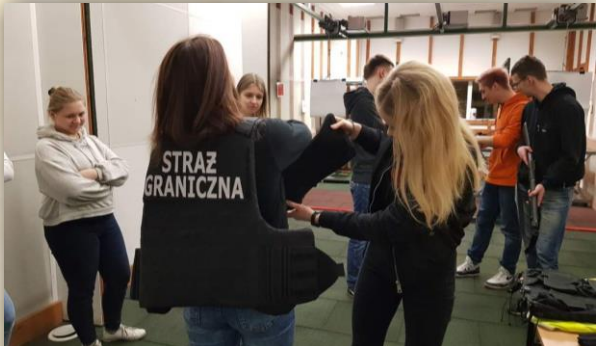
Spotkanie ze Strażą Graniczną