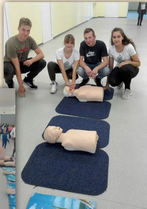
Warsztaty Pierwszej Pomocy